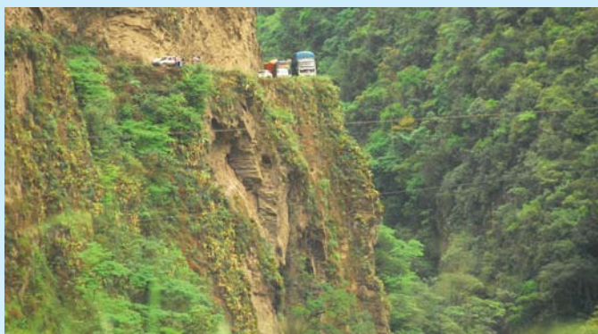
Abgrund ohne Leitplanken: Auf der bolivianischen Camina de la Muerte sterben (zu) viele Menschen.