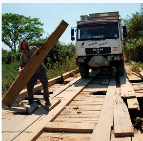
Im Pantanal gleichen die Brücken einem Schweizer Käse.