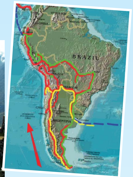
Nach einer kleinen Schleife (gelb) fahren die Recks von Feuerland bis nach Ecuador (grün).