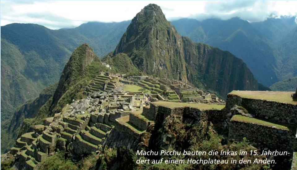
Machu Picchu bauten die Inkas im 15. Jahrhundert auf einem Hochplateau in den Anden.