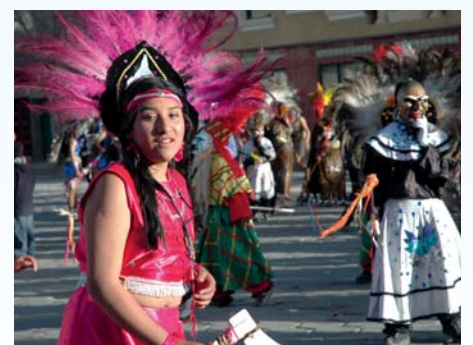
Mitten im Sommer feiern die Einwohner am Uyuni in Bolivien Karneval.